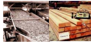
Cuadro N° 2 A: Grupos Industriales con mayor crecimiento en Producción Mayo 2008.