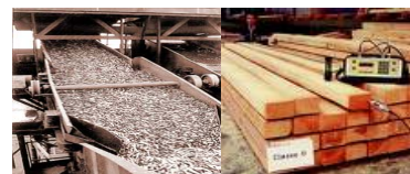
Cuadro N°2 A: Producción, Grupos Industriales con mayor crecimiento junio 2008.